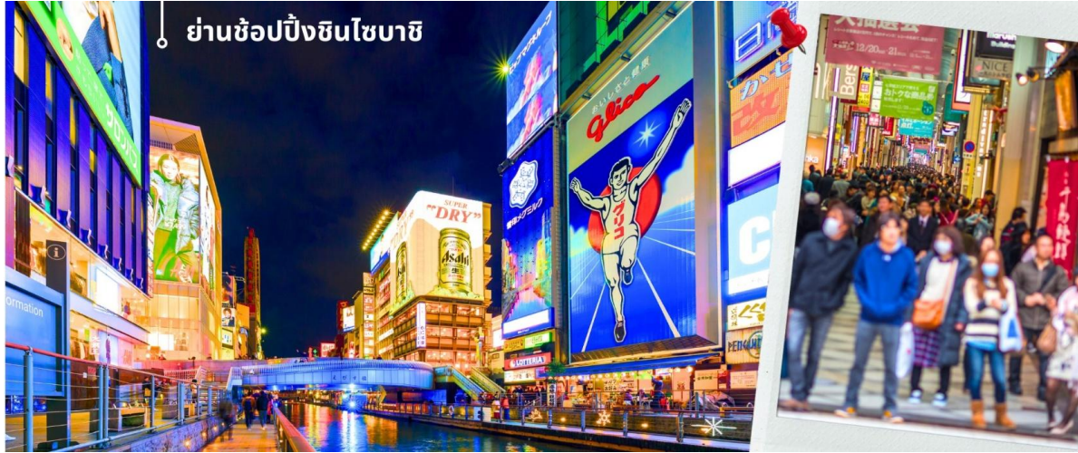
ย่านช้อปปิ้งชิบูยะ