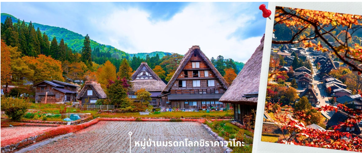
หมู่บ้านมรดกโลกชิราคาวาโกะ

จากนั้นนำท่านเดินทางสู่ เมืองกิฟุ พาท่านเข้าชม หมู่บ้านมรดกโลกชิราคาวาโกะ หมู่บ้านแห่งนี้ ตั้งอยู่ในหุบเขาสูงห่างไกลความเจริญ ทำให้ยังรักษาขนบธรรมเนียม ประเพณีอันดั้งเดิมแบบดั้งเดิมไว้ได้อย่างสมบูรณ์ และเป็นหมู่บ้านที่มีรูปร่างแปลกตาติดอันดับ ซึ่งได้ชื่อว่าเป็น The most beautiful village in Japan โดยมีบ้านทรงแบบ “กัสโซสึคิรี” ซึ่งเป็นบ้านชาวนาโบราณที่มีอายุมากกว่า 250 ปี คำว่า กัสโซ มีความหมายว่า พนมมือ ซึ่งคล้ายกับรูปแบบของบ้านที่มีหลังคามุงด้วยฟางข้าวที่ทำมุมชันถึง 60 องศา รวากับสองมือที่ประนมเข้าหากัน ตัวบ้านมีความยาวประมาณ 18 เมตร กว้าง 10 เมตร ทั้งหลังถูกสร้างขึ้นโดยไม้ไผ่ตะปู ภายหลังในปี 1995 ได้รับการตั้งขึ้นเป็นมรดกโลก