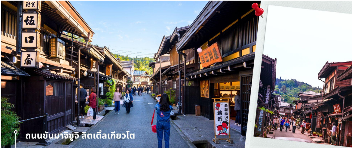
ถนนชานมาจิซุจิ ลิตเติ้ลเกียวโต

จากนั้นให้เวลาท่านเดินเล่นสัมผัสบรรยากาศกันต่อที่ ถนนชานมาจิซุจิ ซึ่งถูกขนานนามว่าเป็น “ลิตเติ้ลเกียวโต” บ้านไม้โบราณโทนสีน้ำตาลดำ เรียงรายไปตามทางเดิน มีคูน้ำอยู่รอบเมือง ปัจจุบันได้มีการปรับเปลี่ยนเป็นร้านค้า ร้านอาหารของที่ระลึก สำหรับนักท่องเที่ยวให้ได้เลือกชมทั้ง ผ้าแฮนด์เมด ชุดยูคาตะ ตุ๊กตาซารุโอะโอะ