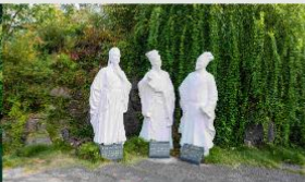
สวนท่าสามสหาย