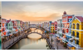
แกรนด์เวิลด์ฟูก๊วก