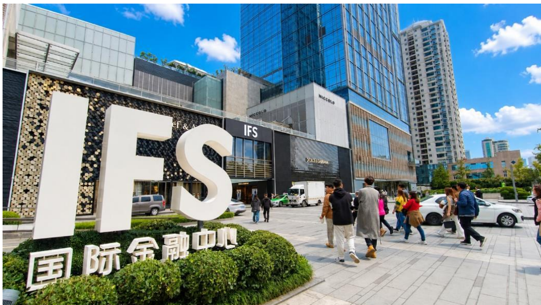
IFS BUILDING ปิ่นตึก หมีแพนด้ายักษ์ปิ่นตึก 4 ชั้น ซึ่งใช้รูปปั้นหมีแพนด้าสีชมพูและดำที่โด่งดังที่สุดของเมืองเฉิงตู

นำท่านเช็คอินที่ หมีแพนด้ายักษ์ปิ่นตึก (IFS BUILDING) เป็นแพนด้าที่อ้วนน่ารักกำลังป้ายปิ่นตึก เป็นประติมากรรมแพนด้ายักษ์แขวนอยู่บนอาคาร IFS ในใจกลางเมืองเฉิงตู ภายในห้างยังมี ร้าน POP MART ขายโมเดลตุ๊กตาสุดฮิต ให้ท่านได้เลือกซื้อเลือกจุ่มได้มากมายให้ท่านต้องไปเสี่ยงจุ่ม 8 อาร์ตทอยยอดนิยม เช่น Molly (มอลลี่) , Skull Panda (สคัล แพนด้า) , Hirono (ฮีโร โนะะ) , Dimoo (ติมู) , Crybaby (ครายเบบี้) , Labubu (ลาบูบู้) , Pucky (ปักกี้) , Sweet Bean (สวีต บี๊น)