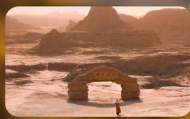
เมืองปีศาจ