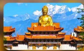
วัดพระใหญ่ทองกงซาน