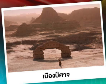
เมืองปีศาจ