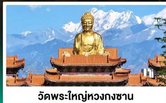
วัดพระใหญ่ทองกงซาน