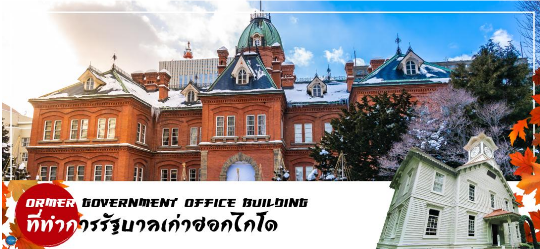
FORMER GOVERNMENT OFFICE BUILDING ที่ทำการรัฐบาลเก่าซอกไกโด

นำท่านเดินทางสู่ ย่านซุซุกิโนะ(Susukino) นับเป็นย่านที่เต็มไปด้วยแหล่งบันเทิงที่โด่งดังมากที่สุดของเมืองซัปโปโร(Sapporo) อีกทั้งยังเรียกได้ว่าเป็นย่านบันเทิงที่ใหญ่ที่สุดในทางตอนเหนือของญี่ปุ่นที่เดียวละคะ บอกเลยว่าอยากมาบันเทิงใจยามค่ำคืนสัมผัสไลฟ์สไตล์แบบคนญี่ปุ่นแท้ๆ ต้องมาที่นี่ให้ได้เลยละคะ เพราะเต็มไปด้วยร้านค้า บาร์ ร้านอาหาร ร้านคาราโอเกะ และตู้ปาจิงโกะ รวมกว่า 4,000 ร้าน บางร้านนี้เปิดจนถึงเที่ยงเที่ยงคืน