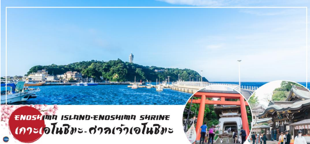
ENOSHIMA ISLAND-ENOSHIMA SHRINE เกาะเอโนชิมะ-ศาลเจ้าเอโนชิมะ

วันที่สอง ท่าอากาศยานนานาชาตินาริตะ – จังหวัดคานากาวะ – เกาะเอโนชิมะ – ศาลเจ้าเอโนชิมะ – ถนนเบนไซเท็นนากามิสะ – จังหวัดยามานาชิ – สวนสาธารณะโออิชิ (ทุ่งดอกโคเดียม) – ลอนเซ็น + ซาปุกุชิ