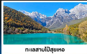
ทะเลสาบไป๋สุยทอ