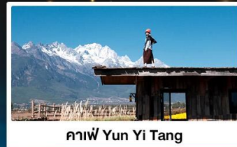
คาเฟ่ Yun Yi Tang