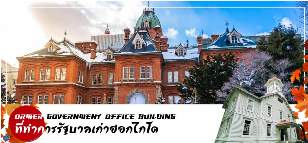
FORMER GOVERNMENT OFFICE BUILDING ที่ทำการรัฐบาลเก่าซอกไกโด

นำท่านเดินทางสู่ ย่านซุซุกิโนะ(Susukino) นับเป็นย่านที่เต็มไปด้วยแหล่งบันเทิงที่โด่งดังมากที่สุดของเมืองซัปโปโร(Sapporo) อีกทั้งยังเรียกได้ว่าเป็นย่านบันเทิงที่ใหญ่ที่สุดในทางตอนเหนือของญี่ปุ่นที่เดียวละคะ บอกเลยว่าอยากมาบันเทิงใจยามค่ำคืนสัมผัสไลฟ์สไตล์แบบคนญี่ปุ่นแท้ๆ ต้องมาที่นี่ให้ได้เลยละคะ เพราะเต็มไปด้วยร้านค้า บาร์ ร้านอาหาร ร้านคาราโอเกะ และตู้ปาจิงโกะ รวมกว่า 4,000 ร้าน บางร้านนี้เปิดจนถึงเที่ยงเที่ยงคืน