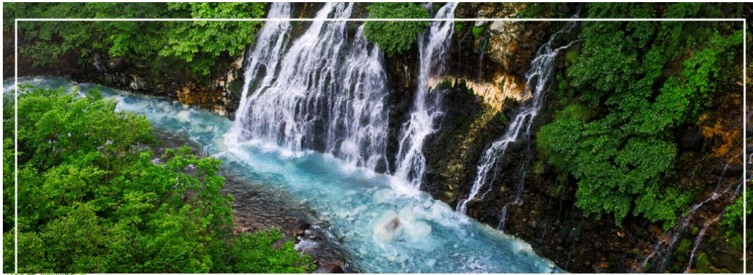
SHIRAHIGE WATERFALL น้ำตกชิราฮิเกะ

วันที่สอง ท่าอากาศยานนิวซีโดเสะ สอกไกโด – เมืองบิเอะ – น้ำตกชิราฮิเกะ – สระอะโออิเคะ หรือ บ่อน้ำสีฟ้า – เมืองอาซาฮิดาว่า – อีออน อาซาฮิดาว่า