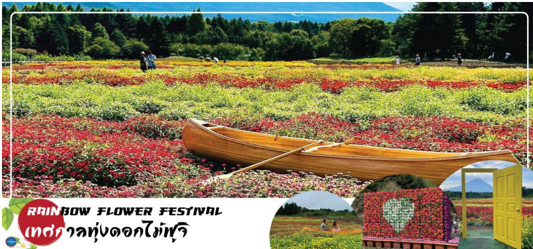
RAINBOW FLOWER FESTIVAL เทศกาลทุ่งดอกไม้ฟูจิ

หรือ ชม Rainbow Flower Festival 2025 (ปกติเทศกาลจะจัดช่วง ปลายเดือนสิงหาคม - ต้นเดือนตุลาคม ซึ่งกำหนดการปีนี้อยู่ไม่มีประกาศอย่างเป็นทางการ) สถานที่จัดงานบริเวณคาวากุจิโกะ เมืองแห่งภูเขาไฟฟูจิ เทศกาลดอกไม้เมืองร้อนที่มีชื่อเสียงของญี่ปุ่น ที่มีเพียงปีละครั้งเท่านั้น ภายในเทศกาลมีการจัดแสดงดอกไม้เมืองร้อนหลากหลายกว่า 10 ชนิด ไม่ว่าจะเป็น ดอกบิโกเนีย, ดอกซินเนีย, ดอกซัลเวีย และดอกกรัดเบเกีย นอกจากนี้ยังสามารถมองเห็นวิวของภูเขาไฟฟูจิได้อีกด้วย ภายในสวนมีจุดให้ถ่ายรูปมากมาย และยังมีสวนดอกไม้สไตล์อังกฤษที่มาร่วมตัวละครมาสดุดสุดน่ารัก "Piter Rabbit English Gardent" และนอกจากนี้ยังมีคาเฟ่ไว้นั่งพักผ่อนชมวิวแบบชิลๆอีกด้วย