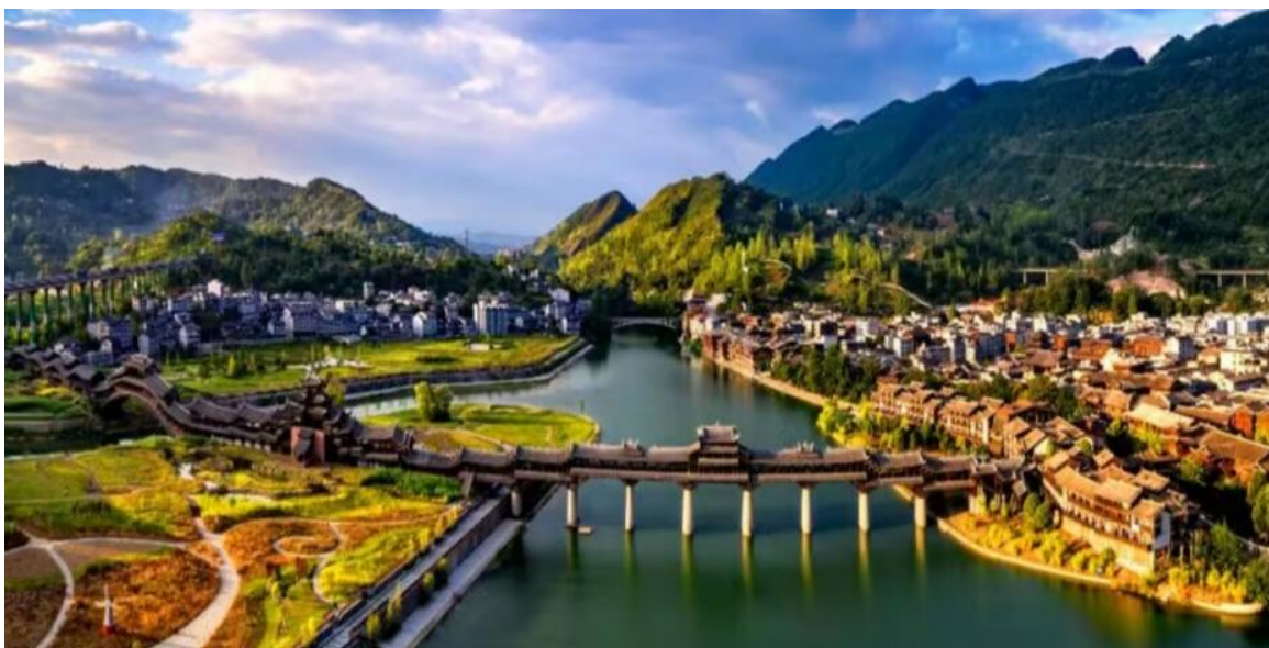
© 2019 NVC. DM000. เชียงใหม่: ๑๖ สิงหาคม ๒๕๖๑. ๕ ชั้น, 4 ลี: (DM)

กลางวัน รับประทานอาหารกลางวัน ณ ภัตตาคาร (มื้อที่ 6) จากนั้นนำท่านเดินทางสู่ เมืองโบราณจ้าวสูย ได้รับการยอมรับว่าเป็นหนึ่งใน 10 สถานที่สำคัญแห่งใหม่ ของฉงชิ่ง ที่นี่มี "สามวังหกลาน" ซึ่งประกอบด้วยวังว่านเถียน วังว่านโซ่ว ลานตระกูลหยู และลานตระกูลฟาน ซึ่งล้วนเป็นอาคารเก่าแก่ทางประวัติศาสตร์และวัฒนธรรม นอกจากนี้ยังมีหอแสดงนิทรรศการที่จัดแสดงวัฒนธรรม "หลักแห่งสวรรค์และมโนธรรม" อุทยานพื้นที่ชุ่มน้ำอาเปิงเจียง และพิพิธภัณฑสถานธรรมชาติและศิลปะ เมืองนี้ได้รับการยอมรับอย่างต่อเนื่องในฐานะเมืองประวัติศาสตร์และวัฒนธรรมแห่งชาติ เมืองที่มีเอกลักษณ์แห่งชาติ เมืองวัฒนธรรมบทกวีแห่งชาติ แหล่งท่องเที่ยวเชิงสถาปัตยกรรมและวัฒนธรรมแบบดั้งเดิมแห่งชาติ ฐานฝึกอบรมสร้างสรรค์ของสมาคมภาพยนตร์จีน และสถาบันภาพยนตร์ปักกิ่ง และฐานบรรเทาความยากจนทางวัฒนธรรม เมืองโบราณแห่งนี้มีสะพานไม้คลุมหลังคาจ้าวสูย ซึ่งได้รับการบันทึกในกินเนสส์เวิลด์เรคคอร์ด และได้รับรางวัล "สะพานไม้คลุมหลังคาแห่งแรกของโลก" จากสมาคมสะพานไม้คลุมหลังคาโลก สะพานไม้คลุมหลังคาแห่งนี้สร้างด้วยสไตล่ออาคารยกพื้นแบบหูเจีย ทอดข้ามแม่น้ำอาเฟิงและแม่น้ำปูฮวา มีความยาว 658 เมตร