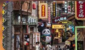
หมู่บ้านสี่ปาตี