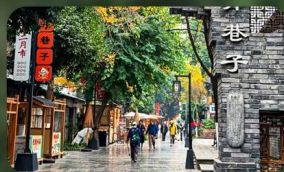
ถนนชวยกวางชวยแคบ