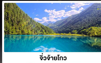
จิ่งจ้ายโกว