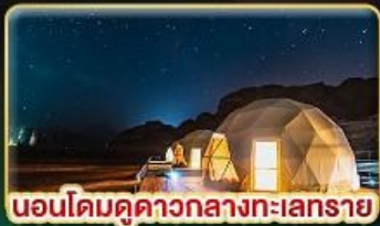
นอนโดมคาวกลางทะเลทราย

บินตรงสู่ "จอร์แดน" เยือน 7 มหัศจรรย์ของโลก