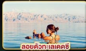
ลอยตัวทะเลเดดซี