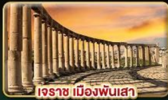
เอราก เมืองพันเสา