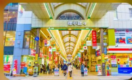
ซัปโปโปะนาทุกุโคจิ