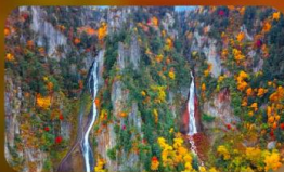
น้ำตกคูทิงกะ และน้ำตกริวเซ