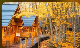
หมู่บ้านนิงเกิลทอเรซ