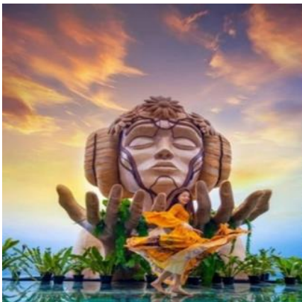
QUHAN_VH01 Update 08 Apr 2026