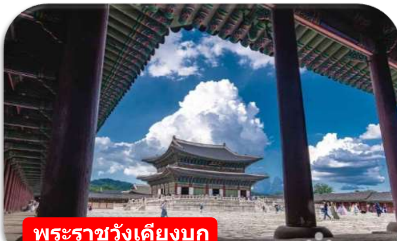
พระราชวังเคียงบก

พระราชวังเคียงบก (Gyeongbokgung) ไม่รวมค่าเช่าชุดฮันบก พระราชวังหลวงที่ยิ่งใหญ่ที่สุดของเกาหลี ท่านสามารถเดินถ่ายรูปภายในพระราชวัง ท่ามกลางสถาปัตยกรรมโบราณอันงดงาม ไม่ว่าจะเป็นท้องพระโรง ศาลาริมสระน้ำ และฉากภูเขาด้านหลังที่สวยงาม พร้อมทั้งเข้าชมพิพิธภัณฑ์พื้นบ้านเกาหลี