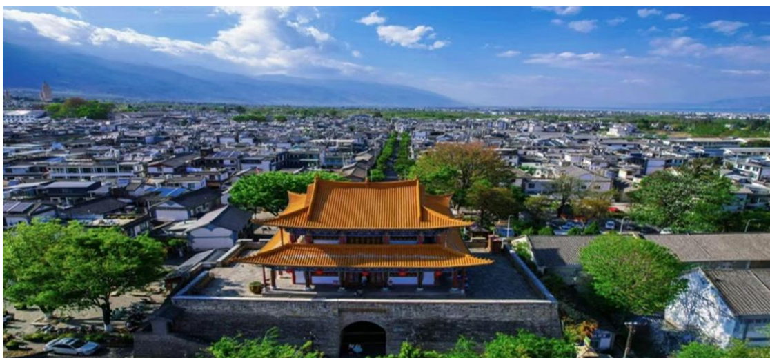
2UKMG-FD002 คุนหมิง ต้าหลี่ ลี่เจียง แชนกรีล่า Romantic Road อ้อมกอดแห่งขุนเขา นั่งรถไฟชมวิวกุเขาหิมะมังกรหยก 6 วัน 5 คืน โดยสายการบินแอร์เอเชีย (FD) เที่ยวบินที่ * RY (FD)

จากนั้นนำท่านเดินทางสู่ เมืองต้าหลี่ (ระยะทางประมาณ 348 ก.ม. ใช้เวลาเดินทางประมาณ 4 ชั่วโมง 30 นาที) เขตปกครองตนเองของชนเผ่าไป๋ ทางตะวันตกเฉียงใต้ของจีนในมณฑลยูนนาน ตั้งอยู่ระหว่างทะเลสาบเอ๋อไห่กับภูเขาฉางชานที่ระดับ 1,975 เมตรเหนือระดับน้ำทะเล โดยมีชนกลุ่มน้อยอาศัยอยู่ร่วมกันกว่า 20 เชื้อชาติ เดิมมีชื่อว่า “หนันเจา” หรืออาณาจักรหนันเจ้า (ค.ศ. 738 – 903) จนกระทั่งชาวไป๋ได้เข้ามาสถาปนาอาณาจักรต้าหลี่ (ค.ศ. 937) และต่อมาในค.ศ. 1253 อาณาจักรต้าหลี่ก็ถูก กุบไลข่าน ผู้เป็นจักรพรรดิชาวมองโกลพิชิตลง แต่ก็ยังคงเหลือร่องรอยอารยธรรมเก่าให้พบเห็นได้บนเส้นทางจากต้าหลี่ถึงลี่เจียง