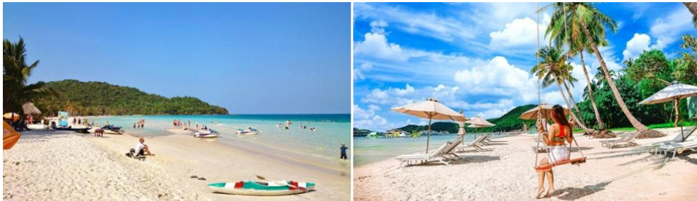
สมควรแก่เวลา นำท่านนั่งกระเช้าลอยฟ้าข้ามทะเลกลับสู่ตัวเมือง

หรือเลือกเดินเล่นถ่ายภาพในสวนน้ำ และเดินชม ชายหาด Hon Thom ได้อย่างอิสระตามอัธยาศัย