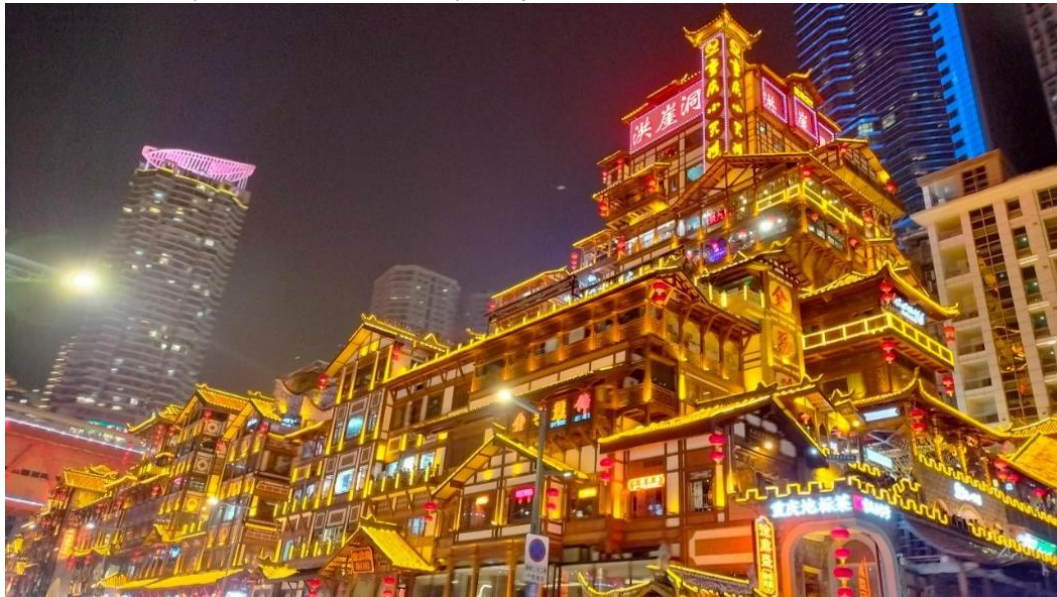
ที่พัก HOLIDAY INN SUITES CHONGQING JINHUI หรือระดับเทียบเท่า 4 ดาว

นำท่านชมความงดงามยามค่ำคืน หงหยาดัง คอมเพล็กซ์ในรูปแบบอาคารโบราณขนาดใหญ่ ภายในมีร้านค้า ร้านอาหาร ร้านขายสินค้าที่ระลึก ฯลฯ ที่นี่ถือเป็นจุดนัดพบพักผ่อนของชาวเมือง และจุดชมวิวชั้นดี อีกทั้งยังเป็นจุดถ่ายรูปที่สำคัญของนักท่องเที่ยวอีกด้วย