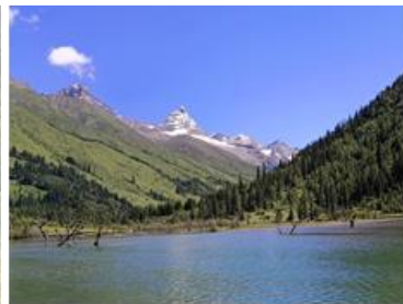
ภูเขาสีครุณี เป็นเมืองสีครุณี ตั้งอยู่บริเวณลุ่มแม่น้ำหมินใจกลางมณฑล มีภูมิประเทศรายรอบไปด้วยเทือกเขา และมีสภาพภูมิอากาศที่เหมาะสมต่อการประกอบอาชีพเกษตรกรรม โดยมีฤดูร้อนที่อบอุ่น ฤดูหนาวที่ไม่หนาวนัก และมีปริมาณความชื้นสูง ประชากรเมืองเฉิงตูมีราว 10 ล้านคน จัดเป็นอันดับ 3 ของประเทศจีน ในปัจจุบันเป็นศูนย์กลางด้านการเมือง การทหาร และด้านการศึกษาของภูมิภาคตะวันตกเฉียงใต้ จากนั้นนำท่านผ่านพิธีการตรวจคนเข้าเมือง