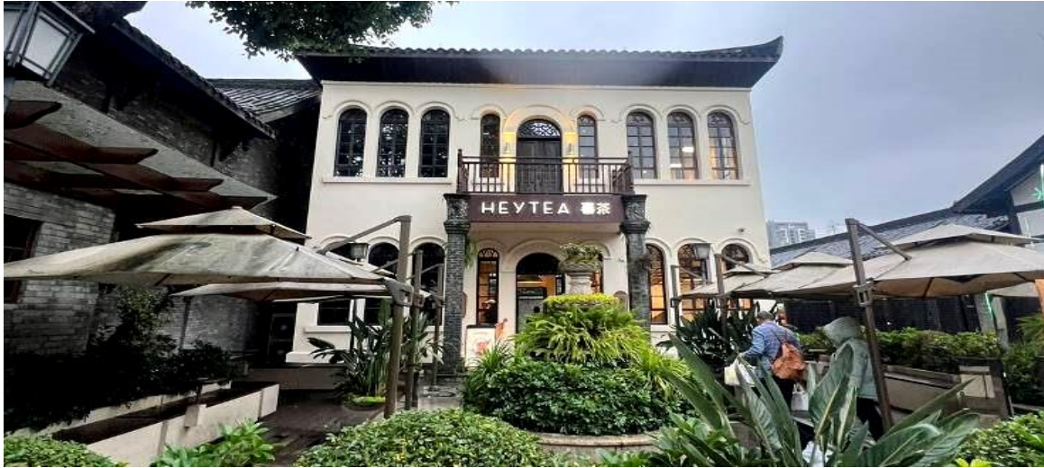
ที่พัก Xingchen Hangdu International Hotel หรือระดับเทียบเท่า 4 ดาว (มาตรฐานจีน)

วันที่ 5 เฉิงตู – ร้านหยก – วัดต้าฉือ – ถนนคนเดินชุนซีลู่ – หมีแพนด้าปิตักIFS – ถนนไท่กุ่หลี่ – สนามบินเฉิงตู (VZ3681 : 23.00 - 01.15+1) กรุงเทพฯ (สนามบินสุวรรณภูมิ)