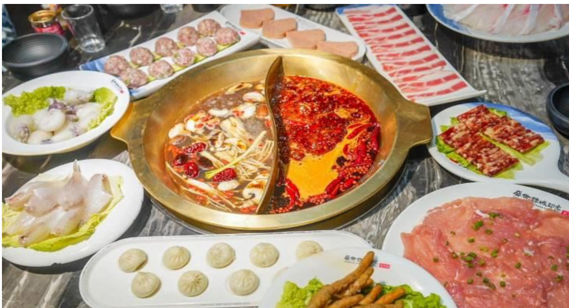
2UTFU-VZ002 เฉิงตู อุทยานป่ฝิ่งโกว อุทยานสัตว์ถิ่น หมีแพนด้าอนเซลฟี เมืองตูเจียงเยียน 5วัน 4คืน โดยสายการบิน Thai Viet Lat Air (VZ)

จากนั้นนำท่านแวะชม ร้านหยก สินค้าเครื่องประดับหยกที่มีคุณภาพและมีชื่อเสียงของประเทศจีน ให้ท่านได้เลือกซื้อ กำไรหยก แหวนหยก หรือผีเสื้อหยกมงคลที่มีชื่อเสียง