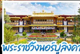
พระราชวังนอร์บูลิงคา