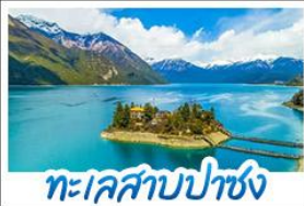
ทะเลสาบปาซง

รถไฟสายหลังคาโลก พระราชวังโปตาลา วัดโจคัง - ทะเลสาบปาซง พระราชวังฤดูร้อนเนอร์บูลิงคา