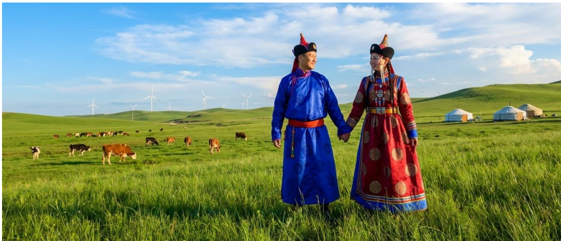
บ่าย นำท่านเข้าร่วมกิจกรรม สวมชุดแบบมองโกล สัมผัสพลังแห่งบรรพบุรุษ สวมเสื้อคลุมแบบดั้งเดิมที่มีสีสันสดใส ปักลวดลายอันประณีต คุณจะสัมผัสได้ถึงพลังแห่งบรรพบุรุษที่เคยปกครองดินแดนครึ่งโลก การสวม