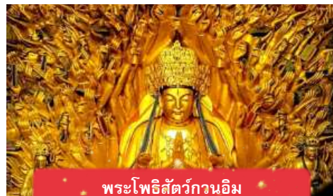
พระโพธิสัตว์กวนอิม

นำท่านเดินทางสู่ มรดกโลกอุทยานผาหินแกะสลักต้าจู๋ ศิลปะหินแกะสลักอันล้ำค่าแห่งเมืองฉงชิ่งมรดกโลกที่องค์การยูเนสโกขึ้นทะเบียนเมื่อปี ค.ศ. 1999 ตั้งอยู่ทางตะวันตกของนครฉงชิ่ง ประเทศจีน ศิลปะหินแกะสลักเหล่านี้สร้างขึ้นตั้งแต่ราชวงศ์ถังจนถึงราชวงศ์ซ่ง มีอายุมากกว่า 1,000 ปีโดดเด่นด้วยงานแกะสลักทางพุทธศาสนาที่งดงามและยังคงสภาพสมบูรณ์ (ใช้เวลาเดินทางประมาณ 1-2 ชั่วโมง)