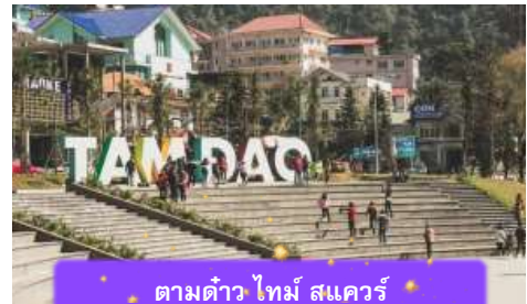
ตามด้าว ไทม์ สแควร์

ที่พัก A25 LUXURY HOTEL ระดับ 4 ดาวมาตรฐานห้องดีน หรือเทียบเท่า