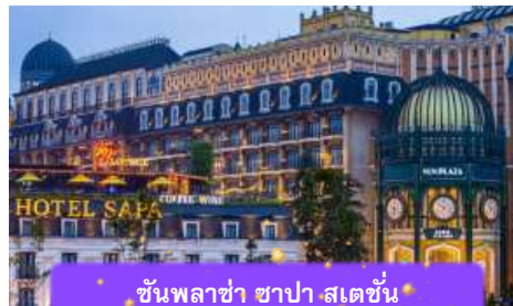
ชั้นพลาซ่า ซาปา สเตชั่น