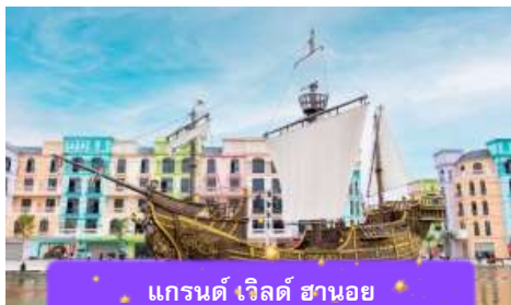
แกรนด์ เวิลด์ สยาม