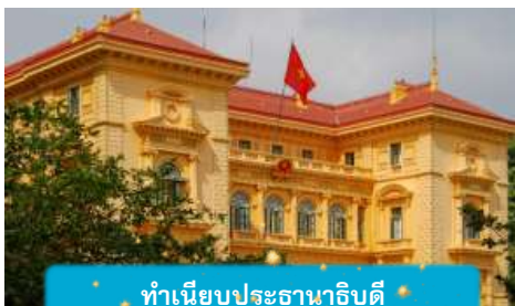
ทำเนียบประธานาธิบดี