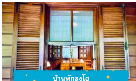
บ้านพักลุงโฮ