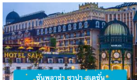
ชันพลาซ่า ซาปา สเตชั่น