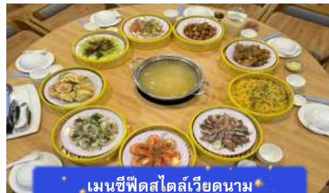
เมนูซีฟู้ดสไตล์เวียดนาม