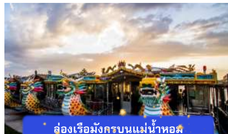
ล่องเรือมังกรบนแม่น้ำหอม

ที่พัก THANH BINH HOTEL ระดับ 4 ดาวมาตรฐานท้องถิ่น หรือเทียบเท่า