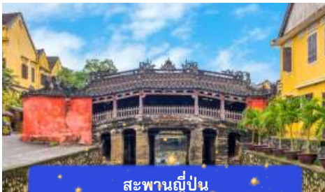
สะพานญี่ปุ่น

จากนั้นนำท่านเดินทางสู่ เมืองโบราณฮอยอัน เมืองมรดกโลกที่ยังคงเอกลักษณ์และรักษาวัฒนธรรมไว้อย่างดีเยี่ยม โดยท่านสามารถ เดินเล่น ถ่ายรูป ตามตรอกซอกซอยต่างๆ ได้ ไฮท์ไลท์ของการมาถ่ายรูปเช็คอินที่นี่คือการได้ขึ้นไปถ่ายรูปจากมุมสูงของคาเฟ่ที่อยู่ ตามซอกซอย นำท่านชม สะพานญี่ปุ่น สะพานแห่งมิตรไมตรี ที่ได้ชื่อนี้เนื่องจากสะพานแห่งนี้สร้างขึ้นโดยชุมชนชาวญี่ปุ่น เป็น สะพานที่สร้างขึ้นข้ามคลองที่ในอดีต 400 ปีกว่าที่ผ่านมา