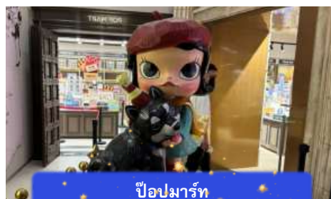
ป๊อปปาร์ท