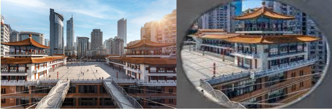
ตึก 22 ชั้น (Kuixing Building)

นำท่านสู่ ถนนโบราณหลงเหมินฮั่ว ย่านถนนหนานปิ่น เดิมเคยเป็นย่านเมืองเก่าของคน ชาวต่างชาติ ปัจจุบันเป็นถนนโบราณทางประวัติศาสตร์และวัฒนธรรมที่ได้รับการอนุรักษ์ไว้ และ ท่านสามารถมองเห็นสะพานข้ามแม่น้ำแยงซีเจียง คือสะพานตงสู่ยเหมิน เป็นสะพานสองชั้น ชั้น ล่างให้รถไฟฟ้าวิ่ง ด้านหลังเป็นเขาหนานซาน