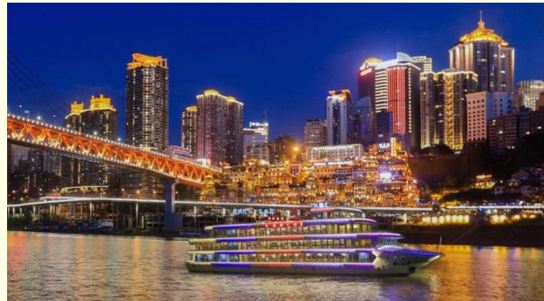
Option เสริม ล่องเรือราตรีชมแม่น้ำสองสาย

*ราคาทัวร์นี้ยังไม่รวมค่าบริการค่าล่องเรือ สำหรับท่านที่สนใจจะมีค่าบริการท่านละ 300 หยวน (ราคาอาจมีการเปลี่ยนแปลง กรุณาตรวจสอบราคาก่อนซื้ออีกครั้ง)*