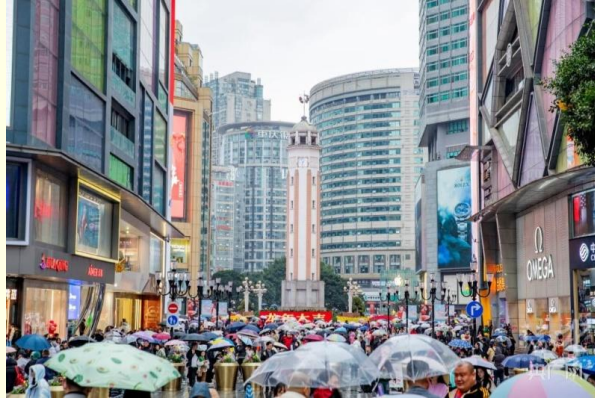
ถนนคนเดินเจี๋ยฟางเป่ย์

และนำท่านไป ถนนคนเดินเจี๋ยฟางเป่ย์ (Jiefangbei Street) ตั้งอยู่บริเวณอนุสาวรีย์ปลดแอก ซึ่งสร้างขึ้นเพื่อรำลึกถึงชัยชนะในการทำสงครามกับญี่ปุ่น แต่ปัจจุบันกลายเป็นศูนย์กลางทางการค้าขนาดใหญ่ ใจกลางเมือง เต็มไปด้วยร้านค้ามากกว่า 3,000 ร้าน ซึ่งมีทั้งอาหาร ซุปปิ้ง มอลล์ขนาดใหญ่ ให้ท่านได้เดินชมและช้อปปิ้งกันอย่างจุใจ