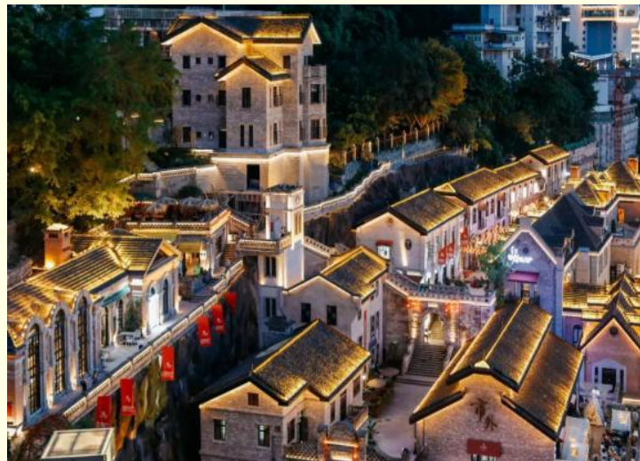
ถนนโบราณหลงเหมินฮั่ว

นำท่านสู่ ถนนโบราณหลงเหมินฮั่ว ย่านถนนหนานปิ่น เดิมเคยเป็นย่านเมืองเก่าของคน ชาวต่างชาติ ปัจจุบันเป็นถนนโบราณทางประวัติศาสตร์และวัฒนธรรมที่ได้รับการอนุรักษ์ไว้ และ ท่านสามารถมองเห็นสะพานข้ามแม่น้ำแยงซีเจียง คือสะพานตงสู่ยเหมิน เป็นสะพานสองชั้น ชั้น ล่างให้รถไฟฟ้าวิ่ง ด้านหลังเป็นเขาหนานซาน