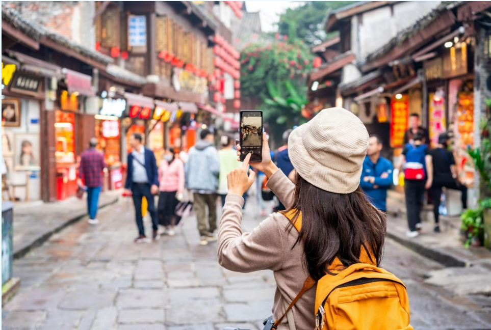
กลางวัน บริการอาหารกลางวัน ณ ภัตตาคารอาหารพื้นเมือง

จากนั้นนำท่านเดินทางสู่ หมู่บ้านโบราณฉีโซ่ว (Ciqikou Ancient Town) เป็นหมู่บ้านอนุรักษ์ ทางวัฒนธรรม และเป็นสถานที่ท่องเที่ยวชื่อดังของมณฑลฉงชิ่ง ลักษณะก็คล้ายๆ กับตลาดเก่าหรือตลาดโบราณบ้านเรา สำหรับคนที่อยากไปย้อนเวลากลับไปในอดีตก็ต้องไปเยือน เพราะที่นี่ยังคงรักษาวิถีชีวิต รวมทั้งสะท้อนรากเหง้าดั้งเดิมของเมืองไว้ได้อย่างดีเยี่ยม ไม่ว่าจะเป็นตึกoramบ้านช่องที่มีรูปทรงโบราณ แหล่งผลิตสินค้า และอาหารพื้นเมืองที่สืบทอดกิจการต่อกันมาหลายรุ่น