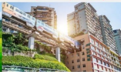
รถไฟทะเลสาบ