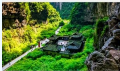
อุทยานแห่งชาติหลุมฟ้า