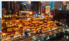
หงหยาดัง(ชมไฟยามค่ำคืน)

*ทางบริษัทฯ ขอสงวนสิทธิ์ในการปรับเปลี่ยนโปรแกรมทัวร์ตามความเหมาะสมขึ้นอยู่กับสถานการณ์หน้างาน โดยคำนึงถึงผลประโยชน์ของลูกค้าเป็นสำคัญ