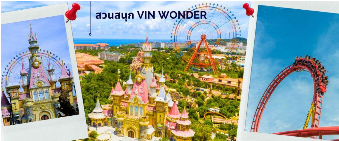
สวนสนุก VIN WONDER

นำท่านพบกับความสุขและเพลิดเพลินไปกับ สวนสนุก VIN WONDERS สวนสนุกขนาดใหญ่ที่ตั้งอยู่บนเกาะฟูโก๊วก และถือเป็นสวนสนุกที่มีขนาดใหญ่ที่สุดของประเทศเวียดนาม ด้วยพื้นที่ขนาด ห้าแสนตารางเมตร และจัดเต็มด้วยเครื่องเล่น หลากหลายรูปแบบ ที่ออกแบบมาให้เหมาะกับนักท่องเที่ยว ทุกเพศทุกวัย นอกจากนี้ยังเต็มไปด้วยร้านค้า ร้านจำหน่ายของที่ระลึก ร้านอาหารและมุมถ่ายภาพประทับใจมากมาย รับรองได้ว่า สายโซเชียล สายคอนเทนท์ จะไม่ผิดหวังแน่นอน