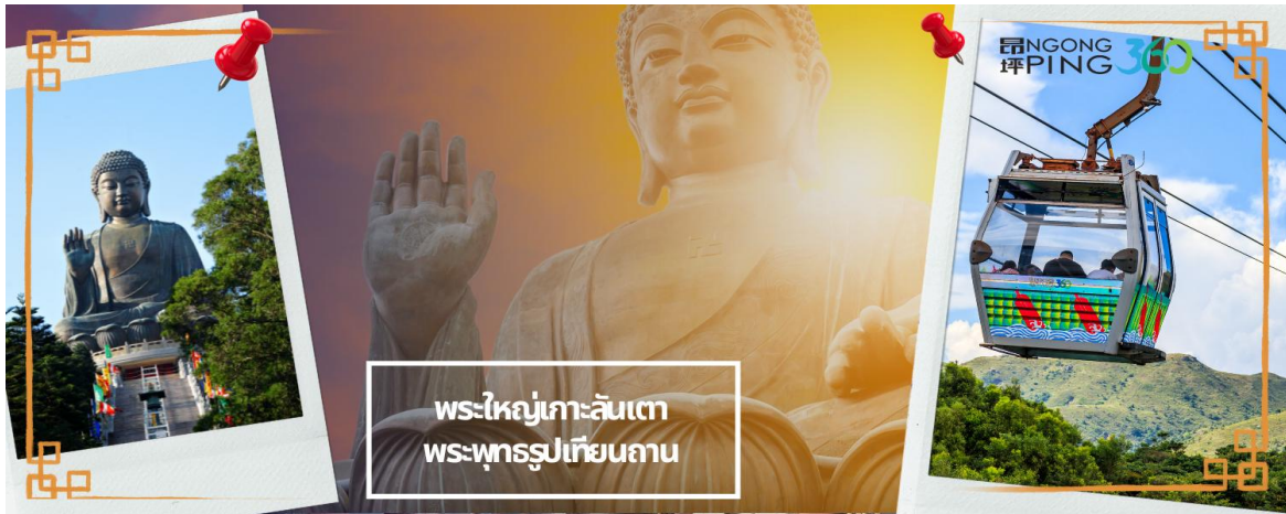
พระใหญ่เกาะลันเตา พระพุทธรูปเทียนถาน

จากนั้นนำท่านช้อปปิ้งที่ ซิตี เกท เอาท์เล็ต (CITY GATE OUTLET) เป็นเอาท์เล็ตขนาดใหญ่ที่สุดของฮ่องกง อยู่ใกล้กับสนามบินฮ่องกง ติดกับสถานีรถไฟ TUNG CHUNG STATION ซึ่งมีสินค้าแบรนด์เนมระดับโลกมากมาย เป็นที่นิยมของนักท่องเที่ยวหรือแม้กระทั่งคนท้องถิ่นเอง ก็มาช้อปปิ้งกันที่นี่ นอกจากส่วนของห้างแล้วยังมีร้านอาหารต่างๆ ศูนย์อาหาร FOOD REPUBLIC, ซูเปอร์มาร์เก็ต, โรงภาพยนตร์ และโรงแรม NOVOTEL CITY GATE HONG KONG ห้าง CITY GATE OUTLET มีแบรนด์ต่างๆให้เลือกมากกว่า 90 แบรนด์ เช่น NIKE, ADDIDAS, NEW BALANCE, BURBERRY, PUMA, TUMI และ TIMBERLAND ให้ท่านได้อิสระช้อปปิ้งกันอย่างจุใจ