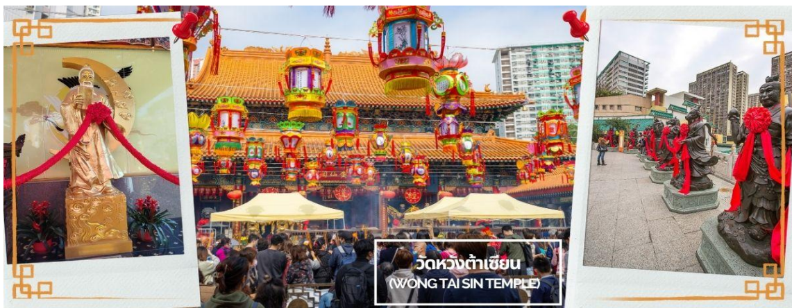
CCXH16 ฮ่องกง พระใหญ่นองปิง ไหว้พระ 6 วัดตั้ง 3วัน 2คืน บิน CX Cathay Pacific (May-Oct 26)