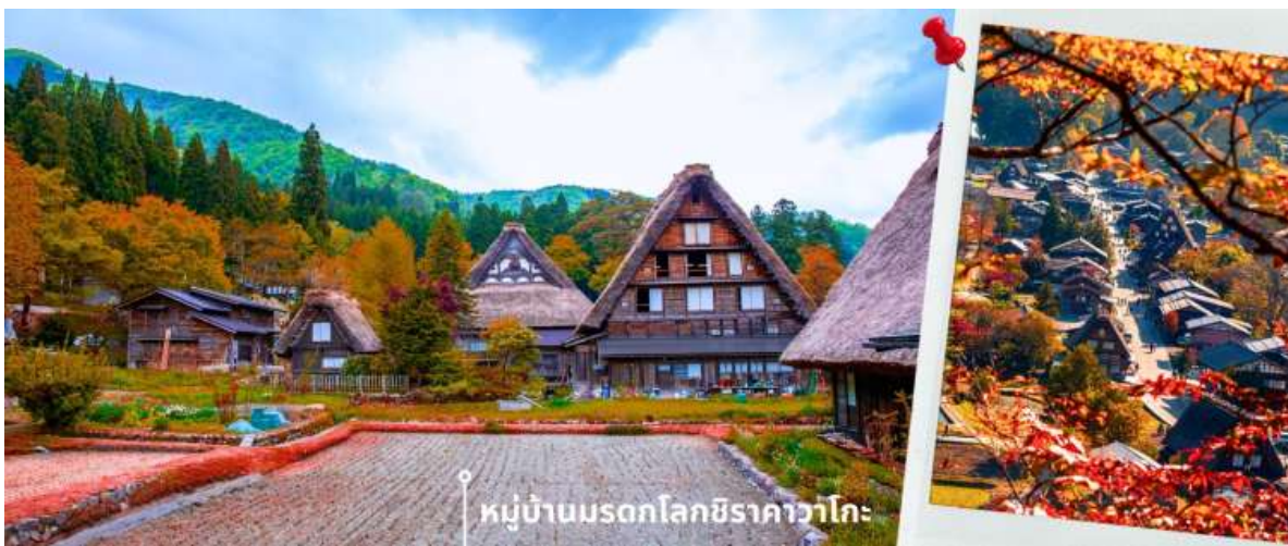
หมู่บ้านมรดกโลกชิราคาวาโกะ

จากนั้นนำท่านเดินทางสู่ เมืองกิฟุ พาท่านเข้าชม หมู่บ้านมรดกโลกชิราคาวาโกะ หมู่บ้านแห่งนี้ ตั้งอยู่ในหุบเขาสูงห่างไกลความเจริญ ทำให้ยังรักษาขนบธรรมเนียม ประเพณีอันดั้งเดิมไว้ได้อย่างสมบูรณ์ และเป็นหมู่บ้านที่มีรูปร่างแปลกตาติดอันดับ ซึ่งได้ชื่อว่าเป็น The most beautiful village in Japan โดยมีบ้านทรงแบบ “กัสโซสึคุริ” ซึ่งเป็นบ้านชาวนาโบราณที่มีอายุมากกว่า 250 ปี คำว่า กัสโซ มีความหมายว่า พนมมือ ซึ่งคล้ายกับรูปแบบของบ้านที่มีหลังคามุงด้วยฟางข้าวที่ทำมุมชันถึง 60 องศา รวากับสองมือที่ประนมเข้าหากัน ตัวบ้านมีความยาวประมาณ 18 เมตร กว้าง 10 เมตร ทั้งหลังถูกสร้างขึ้นโดยไม่ใช้ตะปู ภายหลังในปี 1995 ได้รับการตั้งขึ้นเป็นมรดกโลก