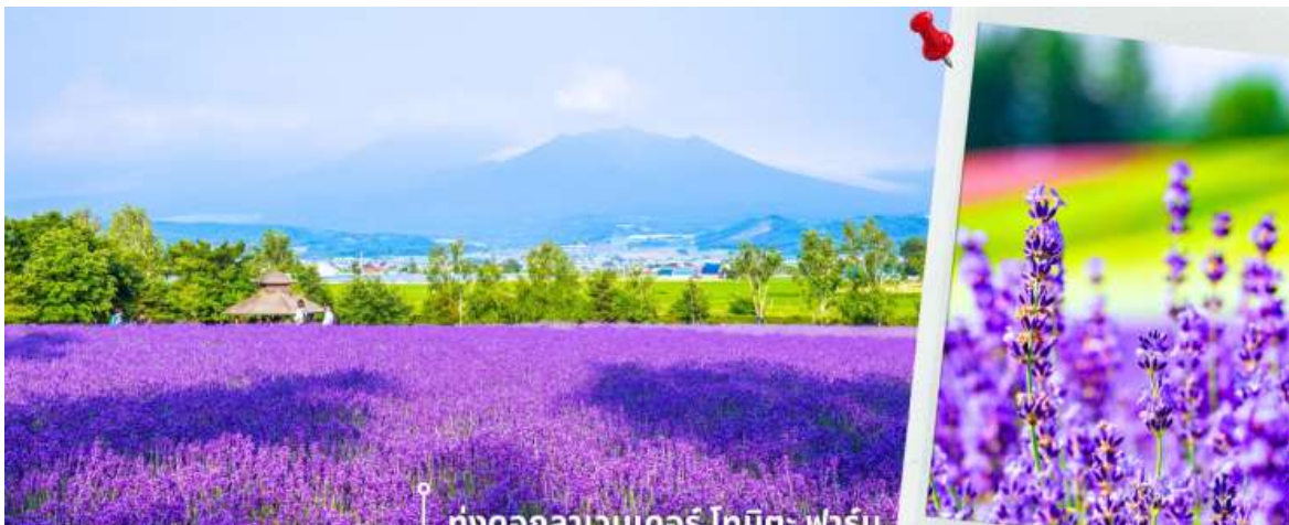
ทุ่งดอกลาเวนเดอร์ โทมิตะ ฟาร์ม

จากนั้นนำท่านเดินทางสู่ ทุ่งดอกลาเวนเดอร์ โทมิตะ ฟาร์ม ตั้งอยู่ในเมืองฟูราโนะ จังหวัดฮอกไกโด เป็นแหล่งชม ทุ่งลาเวนเดอร์ที่มีชื่อเสียงและได้รับความนิยมมากที่สุดแห่งหนึ่งของญี่ปุ่น ในช่วงฤดูร้อน ทุ่งลาเวนเดอร์จะผลิบาน เรียงรายเป็นผืนกว้าง สีม่วงสดใสตัดกับท้องฟ้าและธรรมชาติรอบด้าน สร้างทัศนียภาพที่สวยงามและเป็นเอกลักษณ์ ภายในฟาร์มมีการจัดพื้นที่อย่างเป็นระเบียบ ให้ท่านสามารถเดินชมดอกไม้ ถ่ายภาพ และเพลิดเพลินกับบรรยากาศ นอกจากนี้ยังมีร้านจำหน่ายผลิตภัณฑ์จากลาเวนเดอร์ เช่น ของที่ระลึก ขนม เครื่องดื่ม ให้ท่านได้อิสระตามอัธยาศัย