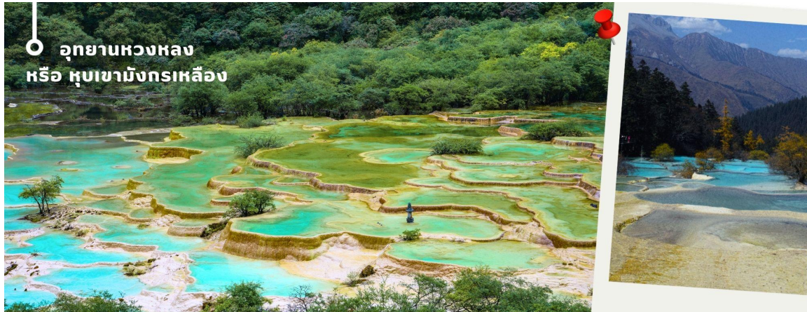
อุทยานหวงหลง หรือ หุบเขามังกรเหลือง

ช่วงเดือนตุลาคมการเปลี่ยนสีของใบไม้ และการตกของหิมะขึ้นอยู่กับสายพันธุ์และสภาพอากาศ