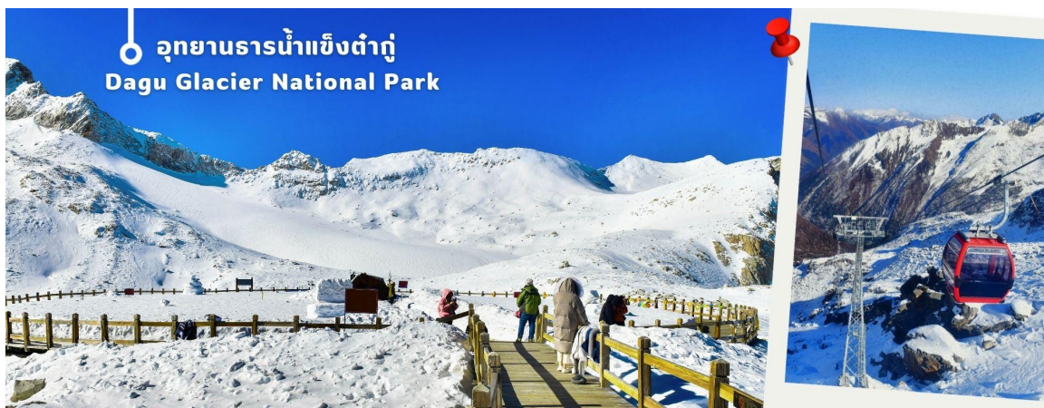
อุทยานธารน้ำแข็งต้ากู่ Dagu Glacier National Park

จากนั้นนำท่านเดินทางสู่ เมืองเฮยสุ่ย (ใช้เวลาเดินทางประมาณ 2 ชั่วโมง)เพื่อเดินทางไปยัง อุทยานธารน้ำแข็งต้ากู่ (รวมกระเช้าขึ้นลง) ต้ากู่ปังชว่น หรือ Dagu Glacier National Park เป็นธารน้ำแข็งกลางเขี้ยวที่สวยงามที่สุดแห่ง