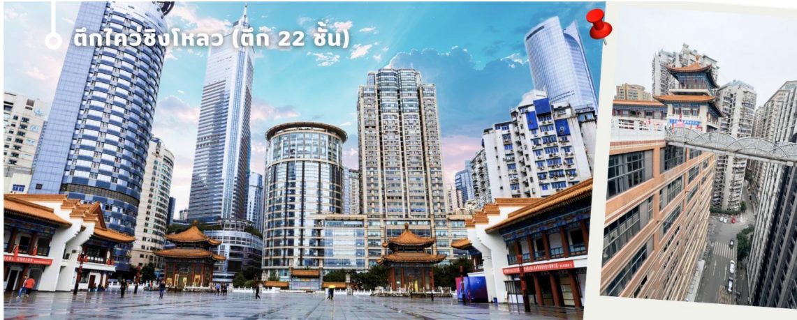
ตึกไควอิ่งโหลว (ตึก 22 ชั้น)

เป็นอาคารที่มีลักษณะพิเศษที่เมืองฉงชิ่ง ประเทศจีน เนื่องจากภูมิประเทศที่เป็นภูเขา อาคารแห่งนี้จึงมีทางเข้าใน ระดับที่ต่างกัน เป็นจุดถ่ายรูปและชมวิวที่โดดเด่นของเมืองฉงชิ่งที่ได้ชื่อว่าเป็น "เมืองสามมิติ"