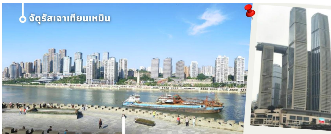
จัตุรัสเฉาเทียนเหมิน

จากนั้น นำท่านเดินทางสู่ จัตุรัสเฉาเทียนเหมิน ซึ่งตั้งอยู่ ณ จุดบรรจบของ แม่น้ำแยงซี และ แม่น้ำเจียหลิง นับเป็น ท่าเรือขนส่งทางน้ำที่ใหญ่ที่สุดของนครฉงชิ่ง และเป็นศูนย์กลางการค้าสำคัญมาอย่างยาวนาน บริเวณนี้ยังเป็นที่ตั้ง ของ ตลาดการค้าครบวงจรเฉาเทียนเหมิน ซึ่งถือเป็นตลาดขนาดใหญ่ที่สุดของฉงชิ่ง ทำให้พื้นที่โดยรอบเต็มไปด้วย ผู้คนและมีชีวิตชีวาอยู่เสมอ ตั้งแต่อดีตจนถึงปัจจุบัน จัตุรัสแห่งนี้ได้รับการออกแบบให้มีลักษณะคล้ายเรือยักษ์ที่ กำลังแล่นออกสู่สายน้ำอย่างสง่างาม จึงได้รับสมญานามว่า "ไททานิคแห่งฉงชิ่ง" เมื่อยืนอยู่บนจัตุรัส ท่านจะ สามารถมองเห็นภาพอันน่าประทับใจของจุดบรรจบระหว่างแม่น้ำสองสาย โดยน้ำสีเหลืองของแม่น้ำแยงซีและน้ำสี เขียวมรกตของแม่น้ำเจียหลิงไหลมาบรรจบกันอย่างชัดเจน สร้างทัศนียภาพที่สวยงามและเป็นเอกลักษณ์ของฉงชิ่ง อย่างแท้จริง