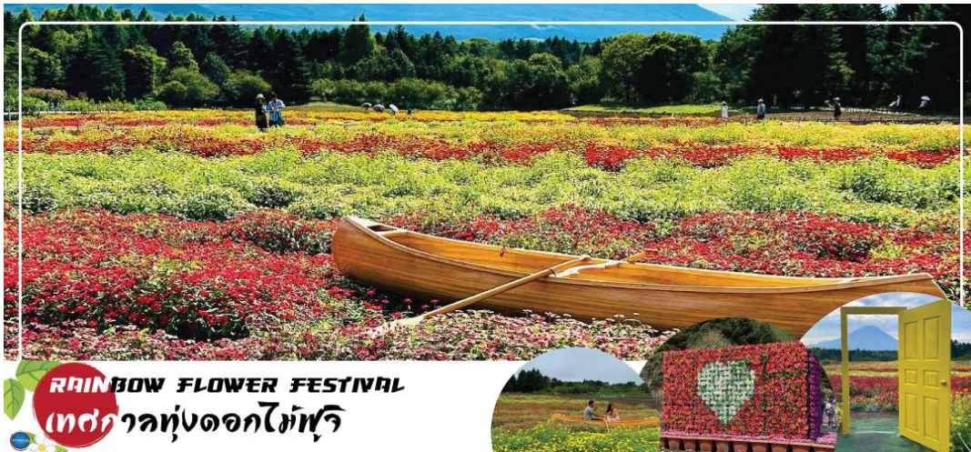
RAINBOW FLOWER FESTIVAL เทศกาลทุ่งดอกไม้ฟูจิ

หรือ ชม Rainbow Flower Festival 2025 (ปกติเทศกาลจะจัดช่วง ปลายเดือนสิงหาคม - ต้นเดือนตุลาคม ซึ่งกำหนดการปีนี้อาจไม่มีประกาศอย่างเป็นทางการ) สถานที่จัดงานบริเวณคาวากุจิโกะ เมืองแห่งภูเขาไฟฟูจิ เทศกาลดอกไม้เมืองร้อนที่มีชื่อเสียงของญี่ปุ่น ที่มีเพียงปีละครั้งเท่านั้น ภายในเทศกาลมีการจัดแสดงดอกไม้เมืองร้อนหลากหลายกว่า 10 ชนิด ไม่ว่าจะเป็น ดอกบิโกเนีย, ดอกซินเนีย, ดอกซัลเวีย และดอกรัตเบเกีย นอกจากนี้ยังสามารถมองเห็นวิวของภูเขาไฟฟูจิได้อีกด้วย ภายในสวนมีจุดให้ถ่ายรูปมากมาย และยังมีสวนดอกไม้สไตล์อังกฤษที่มาร่วมด้วยละครมาสดคอตสุดน่ารัก "Piter Rabbit English Gardent" และนอกจากนี้ยังมีคาเฟ่ไว้นั่งพักผ่อนชมวิวแบบชิลๆอีกด้วย