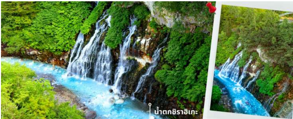
น้ำตกชิราอิเกะ

ลงมา ทำให้เกิดเป็นสีฟ้าที่สดและสวยงาม สีของสระจะไล่ระดับตั้งแต่สีเทอร์ควอยซ์ สีมรกต ไปจนถึงสีน้ำเงิน โคบอลต์ ซึ่งเกิดขึ้นจากสิ่งเจือปนต่าง ๆ ในน้ำที่ไหลจากน้ำตกชิราอิเกะ ถูกลมและลม เมฆ ฝน ปัจจัยต่างเหล่านี้ จะทำให้สีของสระเปลี่ยนแปลงได้ ท่านสามารถชมความงามของบ่อน้ำแห่งนี้ได้ตลอดทั้งปี ให้ท่านอิสระถ่ายภาพตาม อธิบาย จากนั้นนำท่านเดินทางสู่ น้ำตกชิราอิเกะ ตั้งอยู่ที่เมืองบิเอะ เป็นน้ำตกที่มีความสูง 600 เมตร เกิดจากน้ำที่ ชั้นใต้ดินของเทือกเขาโทคาจิไหลลงมาระทบกับน้ำด้านล่าง เป็นหนึ่งในน้ำตกไม่กี่แห่งที่มีน้ำใต้ดินไหลออกมาจาก ชั้นลาวาและชั้นหินอื่นๆ ไหลลงมาระทบกับน้ำด้านล่างทำให้มีลักษณะคล้ายกับหนวดสีขาว ทำให้มีอีกชื่อเรียกว่า “น้ำตกหนวดขาว”(White Beard Waterfall) ทั้งไหลไปรวมที่แม่น้ำบิเอะ รวมถึงบ่อน้ำสีฟ้า อีกด้วยเป็นอีกจุดที่ ทำให้บ่อน้ำสีฟ้ามีสีฟ้าสดอย่างที่เราเห็นกัน น้ำตกแห่งนี้สามารถชมได้ตลอดทั้งปี โดยทิวทัศน์รอบๆก็จะมี ความสวยงามและมีทัศนียภาพที่มีเอกลักษณ์แตกต่างกันไปตามฤดูกาล ในช่วงฤดูร้อน ทิวทัศน์โดยรอบก็จะ เต็มไปด้วย ต้นไม้เขียวชอุ่มอุดมสมบูรณ์ ในช่วงฤดูใบไม้ผลิ เป็นช่วงที่ใบไม้ ต้นไม้จะเริ่มกลับมามีสีสด พร้อมทั้งพืชที่มีดอกก็จะ ผลิตดอกให้เห็นความสวยงาม ฤดูใบไม้ร่วง เป็นช่วงที่สีสนของใบไม้จะสดใสทั้ง สีแดง ส้ม เหลือง ตัดกันกับสีของน้ำได้ อย่างสวยงาม และฤดูหนาว น้ำตกแห่งนี้จะมีความสวยงามเป็นพิเศษ โดยจะมีหิมะสีขาวปกคลุมไปทั่วบริเวณ และ ในตอนกลางคืนจะมีการประดับไฟเพื่อเพิ่มสีสันให้น้ำตกแห่งนี้สวยงามและเพิ่มความโรแมนติกยิ่งขึ้นไปอีก ให้ท่าน อิสระชมบรรยากาศและเก็บภาพความสวยงามตามอธิบาย ก่อนเดินทางสู่เมืองอาซาฮิกาวา