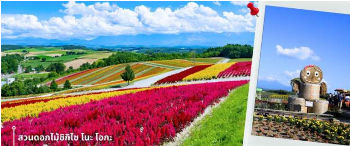
สวนดอกไม้ชิกิไซ โนะ โอะกะ

หลังรับประทานอาหารเช้า นำท่านเดินทางสู่ สวนดอกไม้ชิกิไซ โนะ โอะกะ ชื่อเต็มๆว่า Panoramic Flower Gardens Shikisai No Oka ซึ่งในช่วงซัมเมอร์จะเป็นเนินเขาสีสันสดใสกว้างสุดสายตา พื้นที่กว่า 15 เฮกตาร์ หรือประมาณ 93 ไร่ เป็นสถานที่ที่ได้ชื่อว่า มีความสวยงามทั้ง 4 ฤดู ที่สวนแห่งนี้จะมีดอกไม้หลากหลายสายพันธุ์ ทั้ง ลาเวนเดอร์ ทิวลิป โคเคีย ทานตะวัน และอื่นๆ มากกว่า 30 ชนิดที่สลับกันไปตามฤดูกาล อย่างในช่วงซัมเมอร์ คือช่วงเวลาที่ดี บรรดาดอกไม้และพืชพันธุ์จะบานสะพรั่งสุดสายตา พร้อมกับบรรยากาศอันสดใสรวมถึงกิจกรรมกลางแจ้งที่ท่านเพลิดเพลิน โดยแต่ละช่วงเวลาจะมีดอกไม้ประจำฤดูกาลบานต้อนรับในบรรยากาศสดชื่น และยัง มีทิวเขาที่งดงามเป็นเหมือนฉากหลัง ให้ท่านได้อิสระเดินชมความสวยงามและเก็บภาพความประทับใจ