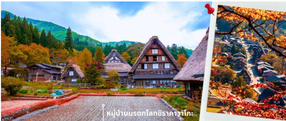
หมู่บ้านมรดกโลกชิราคาวาโกะ

จากนั้นนำท่านเดินทางสู่ เมืองกิฟุ พาท่านเข้าชม หมู่บ้านมรดกโลกชิราคาวาโกะ หมู่บ้านแห่งนี้ ตั้งอยู่ในหุบเขาสูงห่างไกลความเจริญ ทำให้ยังรักษาขนบธรรมเนียม ประเพณีอันดั้งเดิมไว้ได้อย่างสมบูรณ์ และเป็นหมู่บ้านที่มีรูปร่างแปลกตาติดอันดับ ซึ่งได้ชื่อว่าเป็น The most beautiful village in Japan โดยมีบ้านทรงแบบ “กัสโซสึคุริ” ซึ่งเป็นบ้านชาวนาโบราณที่มีอายุมากกว่า 250 ปี คำว่า กัสโซ มีความหมายว่า พนมมือ ซึ่งคล้ายกับรูปแบบของบ้านที่มีหลังคามุงด้วยฟางข้าวที่ทำมุมชันถึง 60 องศา รวากับสองมือที่ประนมเข้าหากัน ตัวบ้านมีความยาวประมาณ 18 เมตร กว้าง 10 เมตร ทั้งหลังถูกสร้างขึ้นโดยไม่ใช้ตะปู ภายหลังในปี 1995 ได้รับการตั้งขึ้นเป็นมรดกโลก