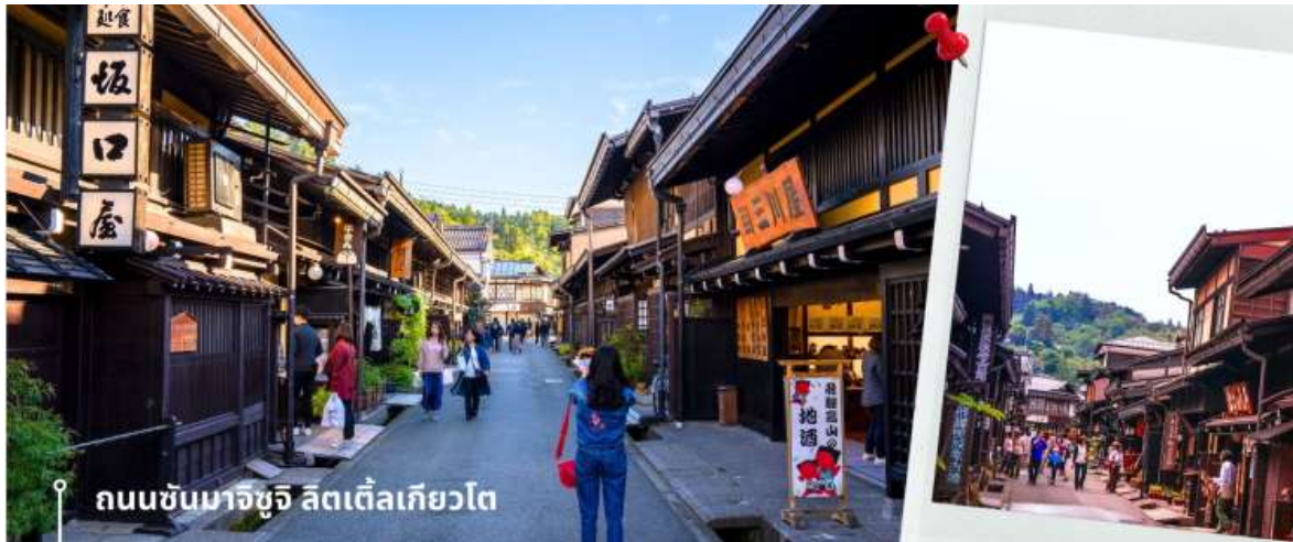
ถนนซันมาจิซุจิ ลิตเติ้ลเกียวโต

จากนั้นให้เวลาท่านเดินเล่นสัมผัสบรรยากาศกันต่อที่ ถนนซันมาจิซุจิ ซึ่งถูกขนานนามว่าเป็น “ลิตเติ้ลเกียวโต” บ้านไม้โบราณโทสนี้น่าตาลด่า เรียงรายไปตามทางเดิน มีคูน้ำอยู่รอบเมือง ปัจจุบันได้มีการปรับเปลี่ยนเป็นร้านค้า ร้านอาหารของที่ระลึก สำหรับนักท่องเที่ยวให้ได้เลือกชมทั้ง ผ้าแฮนด์เมด ชุดยูคาตะ ตุ๊กตาซารุโอะโอะ