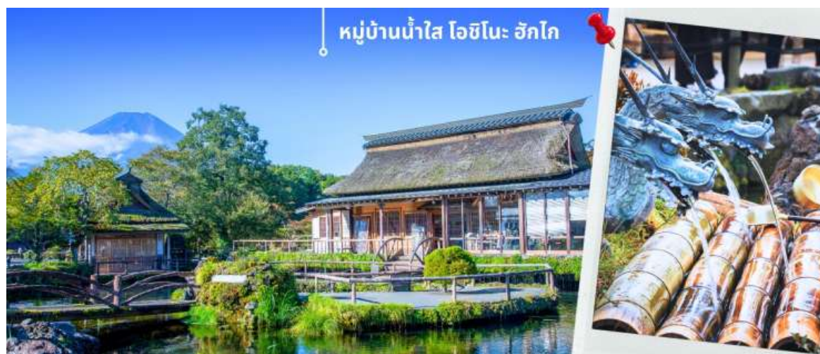
หมู่บ้านน้ำใส โอชิโนะ ฮักไก

หลังรับประทานอาหารเที่ยง นำท่านเดินทางสู่ หมู่บ้านน้ำใส โอชิโนะ ฮักไก (Oshino hakkai) ถือเป็นหมู่บ้านแห่งการท่องเที่ยวที่ยังคงความอุดมสมบูรณ์ของธรรมชาติเอาไว้ได้อย่างดีในหมู่บ้านมีบ่อน้ำใสที่เป็นน้ำที่ละลายมาจากหิมะบนภูเขาไฟฟูจิ ที่นี้มีความสวยงามในระดับที่ว่าได้รับการขึ้นทะเบียนให้เป็นมรดกทางธรรมชาติ ในปี ค.ศ. 1934 และได้รับคัดเลือกให้เป็นหนึ่งในภูมิทัศน์ทางน้ำทั้งดงามในปีค.ศ. 1985 อีกด้วย ไฮไลท์ในช่วงนี้ เราจะสามารถเห็นบรรยากาศหมู่บ้านที่ปกคลุมไปด้วยไม้เขียวขจี ทั่วบริเวณ ให้ความสวยงามและความโรแมนติกไปอีกแบบ ทั้งยังเป็นอีกหนึ่งสถานที่ที่เราสามารถมองเห็นวิวฟูจิ หากวันนั้นเป็นวันที่ฟ้าเปิด