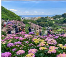
เทศกาลดอกไฮเดรนเยีย