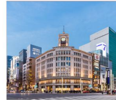
กินซ่าช้อปปิ้ง

THAI สายการบินไทย บริการทุกระดับประทับใจ FULL SERVICE