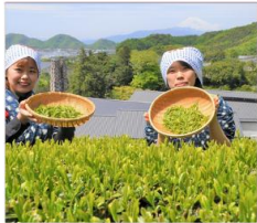
กิจกรรมเก็บชา