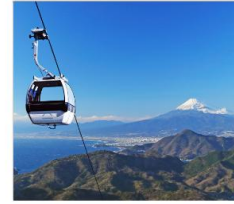
ชิซุพานอรามาวิว