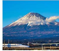
นั่งชินคันเซนชมฟูจิ