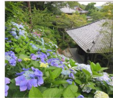
วัดฮาเซเดระ(เดรนเยีย)