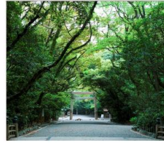
ศาลเจ้าอัสึตะ