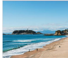
เกาะเอโนชิมะ